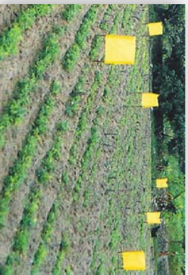
Trampas Estáticas en una parcela de investigación, Zona Cieneguillo - Purua.

a. Trampas Estáticas: Son las que van a quedar en campo, son de fácil confección, se corta el plástico de 50 cm x 70 cm, se embarra por ambos lados aceite de dos tiempos para que no chorree, se coloca en dos estacas previamente se cose el plástico del grosor de las estacas, se coloca en el campo por encima de 15 cm de las plantas, evitando contacto del aceite con las hojas. Para poder instalarlas en el campo se instala una y luego cada 60 pasos se coloca otra, la idea es que deben de estar bien distribuidas en el campo. Deben ser cambiadas cuando este seco el aceite, solamente se lavan y se vuelve a realizar lo mismos pasos para su instalación. Para monitoreo se ha empleado hasta 2 trampas por campo y para control de plagas hasta 60 trampas por hectárea.