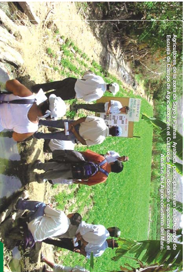
Agricultores de la zona de Suyo y Palmira Ayabaca, participan en un día de campo de la Escuela de Campo de Agricultores en el Cultivo de Maní, donde se capacitan sobre el Análisis del Agroecosistema del Maní.

La importancia de evaluar constantemente nuestros campos es fundamental para tomar la mejor decisión, no podemos seguir con la evaluación a medias; una buena evaluación nos llevará a una decisión acertada de que hacer cuando se nos presenta cierta situación en el campo; es así que el Manejo Integrado de Plagas, viene a ser la estrategia basada en la evaluación del agro ecosistema, implica métodos de control integrado, mecánico, físico, cultural, genético, biológico, etológico, legal y como última opción el químico.