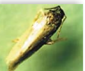
Mariposa estado adulto