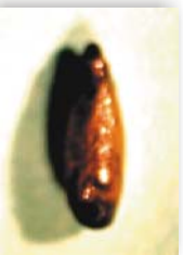
Pupa estado inmaduro