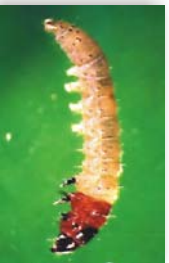
Larva estado inmaduro