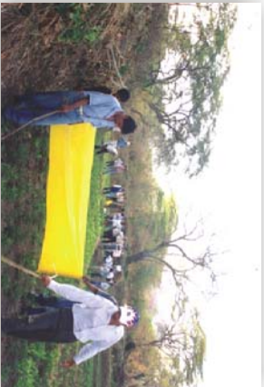
Práctica del montaje en un intercambio local con el apoyo del SENASA.

b. Trampas móviles: Son también de fácil confección, la manta debe medir 3 a 4 metros de largo de acuerdo a la disposición del terreno, y de 1 metro de ancho. se fijan a dos parantes en cada extremo para darle soporte al plástico. Se embarra con aceite de cocina a ambos lados, y se procede a pasar por el campo, pueden ser tres las personas a realizar esta operación, pues dos pasan la manta y el tercero puede ir moviendo las plantas en la parte delantera, se debe procurar no tocar mucho las hojas de las plantas con la manta ya que se pueden quemar con el aceite, por ello el pase de la trampa móvil debe ser un poco rápido, una vez realizado el pase se lava la manta y se usa de la misma forma para el siguiente pase. En cuanto a la frecuencia de pase de la manta depende de la incidencia de la plaga.