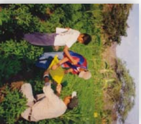
En una parcela de aprendizaje de la ECAs El Torno se instalaron trampas amarillas, promotor e hijo aprenden esta tecnología